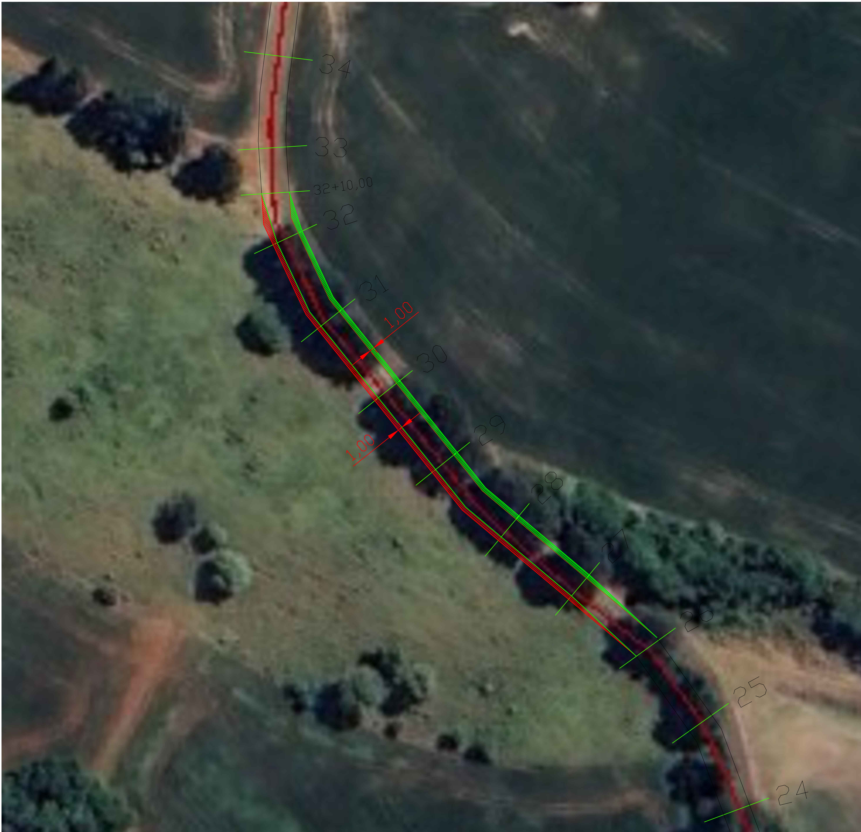
PLANTA DE DEMOLIÇÃO E CONSTRUÇÃO Escala: 1:500

TRAÇADO ATUAL - A SER MODIFICADO NOVO TRAÇADO - A SER EXECUTADO